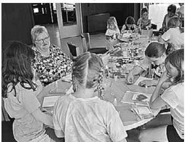
Mitorganisatorin Burgl steht mit Rat und Tat zur Seite