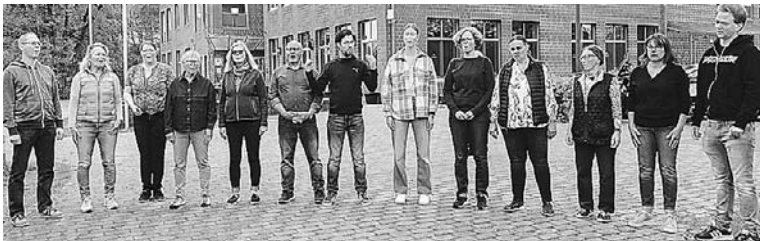
Gemischter Chor Großmoor beim Einsingen.