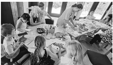
Die Gruppe beim Arbeiten und Bewundern der anderen Karten