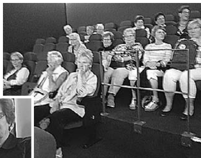
Gemeinsam statt einsam ist das SoVD Motto!

Immer den 3. Freitag im Monat trifft sich der SoVD Wathlingen zum Fisch essen und Kino im 4 G PARK. Es fanden sich diesmal 33 Mitglieder und Freunde des SoVD OV Wathlingen zum gemeinsamen Essen zusammen. Viele Ideen und Wünsche wurden geäußert für gemeinsame Unternehmungen.