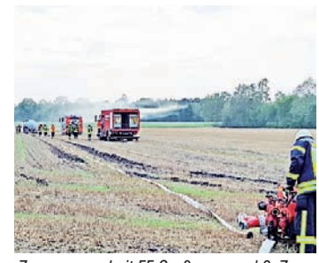
Zusammenarbeit FF Großmoor und 3. Zug Kreisfeuerwehrbereitschaft