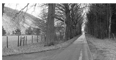
Bereich westlich der Kalihalde Wathlingen, der nur wenige hundert Meter vom FFH-Auwald- und Naturschutzgebiet Brand entfernt liegt. Die Samtgemeinde Wathlingen könnte und sollte endlich den Flächennutzungsplan ändern, damit die Fläche statt für eine Abfalldeponie für unsere wertvolle Natur genutzt werden kann