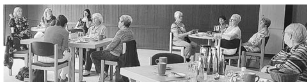
Angeregt wurde sich in der Runde darüber ausgetauscht, wie ehrenamtliches Engagement im Spannungsfeld zwischen familiären Verpflichtungen und Beruf verwirklicht werden kann

Nienhorst gefolgt. Dies waren nicht nur Frauen der SoVD Ortsverbände, auch Interessierte aus der Samtgemeinde Wathlingen waren gekommen.