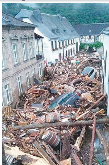
Kaum vorstellbar – So sieht es derzeit in Ahrweiler/Walporzheim aus

Damit gerade die Kinder und Jugendlichen wieder Fuß fassen können und sich ihrem Sport widmen können um auch Dinge, die sie jetzt erleben, verarbeiten zu können, haben wir ein Spendenkonto eingerichtet. Das Geld wird zu 100 Prozent dem Verein HTC Bad Neuenahr/Ahrweiler zweckgebunden für den Wiederaufbau der Sportanlagen und Wiederaufnahme des Übungsbetriebes übersandt und von uns direkt an den Vorstand übergeben, mit dem ich in Kontakt stehe. Ihnen allen aus unserem Dorf darf ich ans Herz legen, mit einer Spende den Menschen in den betroffenen Gebieten zu helfen. Wenn Sie für unsere Unterstützung spenden wollen, dann kommt hier jetzt das Spendenkonto Samtgemeinde Wathlingen (Gemeinde Nienhagen) Sparkasse Celle IBAN DE37 2695 1311 0064422553 NOLADE21GFW Flutopferhilfe Ahrweiler /HTC Bad Neuenahr Jörg Makel