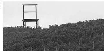
Der „Kaiserstuhl“ mitten auf dem Weinberg