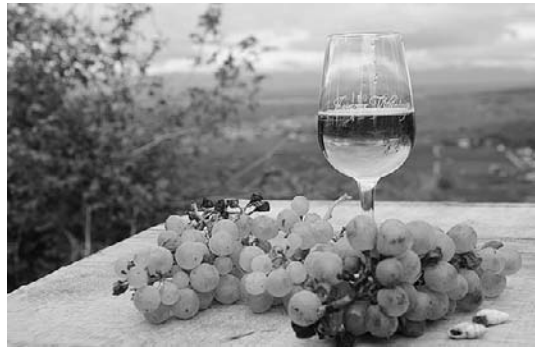
Ein gutes Tröpfchen mit Blick auf die Vogesen