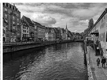
Fahrt auf der Ill