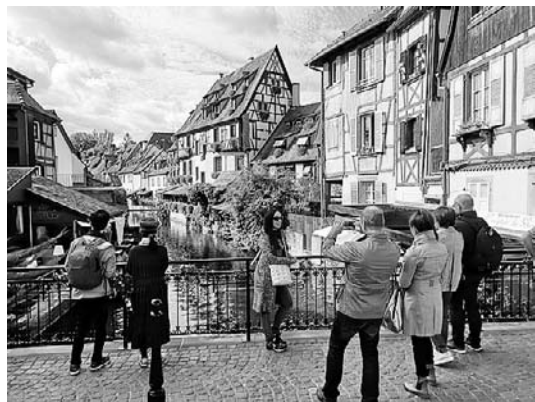
Klein Venedig in Colmar