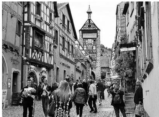
Geschäftiges Treiben in Riquewihir mit Stadttor