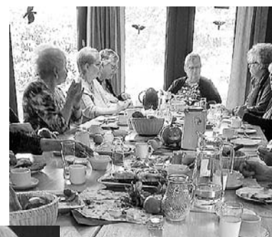
An dem herbstlich gedeckten Tisch ließen sich die SoVD-Frauen und Gäste das Frühstücksbuffet schmecken