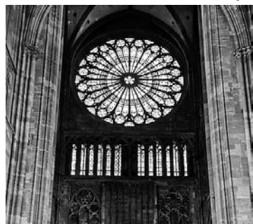
Die große Rosette