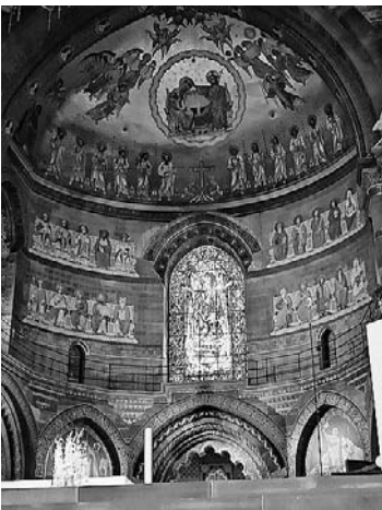
Im Straßburger Münster