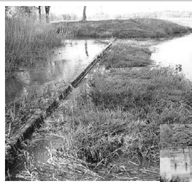
Mündung der Alten Aue in die Fuhse, oben links der Fuhsekanal

Der Fuhsekanal verläuft von Nienhagen über Bennebostel, Adelheidsdorf, Westercelle, Wietzenbruch nach Hambühren und mündet danach in die Aller. Der Fuhsekanal hat eine Länge von 12,2km und wurde von Hand, von 1766 bis 1769 gegraben. Der Fuhsekanal sollte bei