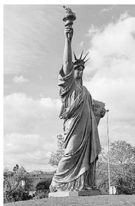
Die Freiheitsstatue von Colmar