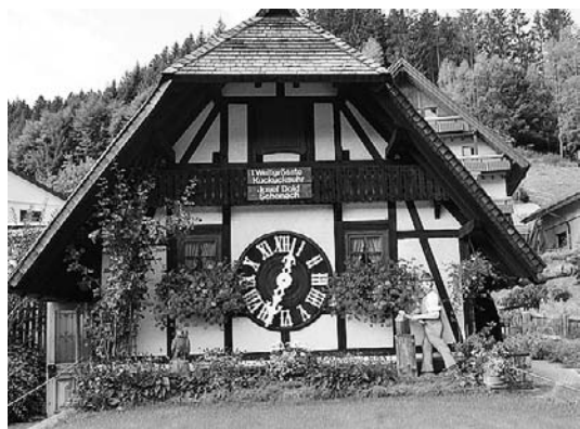
Die Weltgrößte Kuckucksuhr