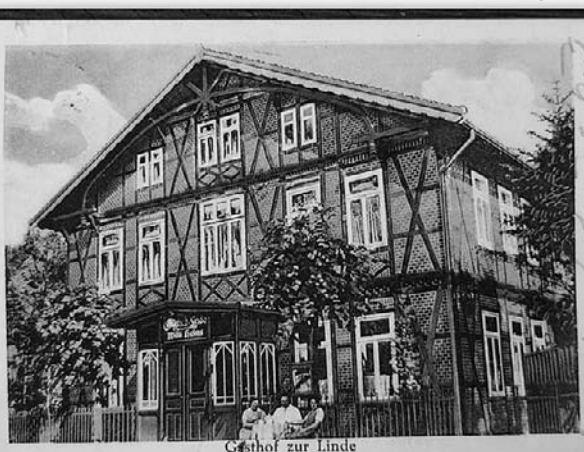
Gasthof zur Linde