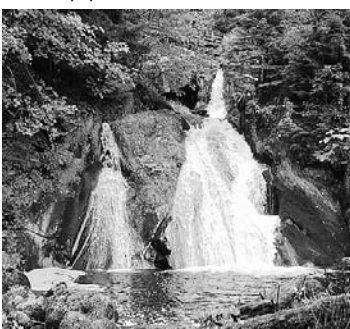
Die Triberger Wasserfälle