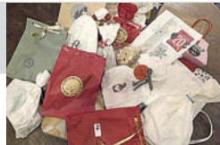
Der Adventskalender beinhaltet 24 Überraschungspäckchen verschiedenster Art - für jeden Tag eine Überraschung

Kissen werden besonders von Patientinnen, Patienten und Angehörigen geschätzt. Sie spenden Trost, geben Halt und stehen symbolisch für Zuwendung und Anteilnahme. Ihre Übergabe sorgte für emotionale, berührende Momente. Mittlerweile sind die ersten Türen geöffnet, und die Freude darüber, welche liebevollen Überraschungen zum Vorschein kommen, ist überall zu spüren. Viele können es kaum erwarten, das nächste Päckchen in den Händen zu halten. Schon jetzt steht fest: Auch im kommenden Jahr wird diese besondere Tradition weitergeführt, denn sie zeigt jedes Jahr aufs Neue, wie viel Wärme, Gemeinschaft und Menschlichkeit entstehen, wenn viele Menschen ein kleines Stück ihrer Zeit und Kreativität teilen.