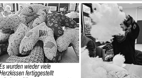
Es wurden wieder viele Herzkissen fertiggestellt

Der Vorstand des SoVD Ortsverbandes Nienhagen freut sich, dass bei den bisherigen Treffen schon fast 200 Herzkissen von fleißigen Unterstützerinnen und Unterstützern fertiggestellt wurden. Aber es warten noch viele weitere Kissen auf ihre Fertigstellung. Das nächste Treffen der „Herzkissen-Aktion“ ist am 3. Juni 2026